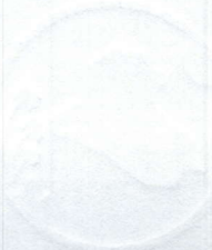
Mohammed AL - Halboosi Speaker of the Iraqi Council of Representatives Baghdad - August 2023